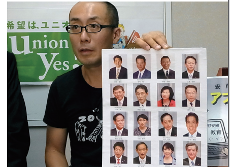
「超タカ派改造内閣」に負けないぞ！ (9/10)

確かにいま人々は「何かしなくては」と動きは始めている。昨年秋の「秘密保護法」強行可決、そして 7 月 1 日のクーデターともいふべき「集団的自衛権の閣議決定」など、安倍政権