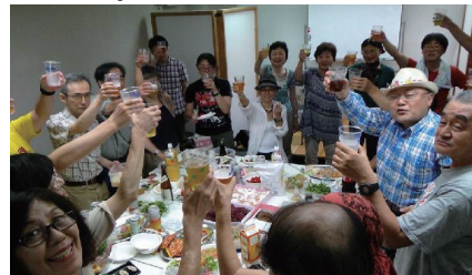
納涼パーティ (8/20) に 50 人が参加

の暴走が止まらないからだ。そして、9 月の内閣改造で安倍政権はいっそう右寄りになり、「超タカ派極右改憲内閣」（五十嵐仁さん命名）の出現にまで至った。追い打ちをかけるように起きたのが「朝日新聞」の吉田証言「誤報・謝罪」問題。右派メディア・安倍政権が一体となった「朝日バッシング」キャンペーンは、「戦争前夜・言論統制」の様相を呈している。