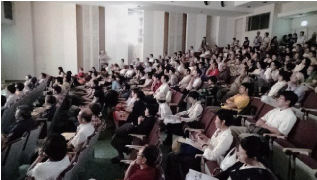
今年も盛況だったレイバー映画祭 (7/26)

ことしのレイバー映画祭 2014 は 7 月 26 日、田町交通ビル 6F ホールで開催された。2013 年に引き続き、今回も一日中ほぼ満席で計 380 人が集まった。ある若い男性は、「偶然誘われてきた。映画を観て感動に打ち震えた。こういう世界を知らなかった」と興奮ぎみに語っていた。この日上映したのは、『60 万回のトライ』『あしたが消える』『A2-B-C』『続・メトロレディーブルース』『食欲の帝国』の 5 作品だったが、プログラムがいい、との評価が多かった。レイバー映画祭が他の映画祭と違うのは、単に「いい作品」というだけでなく、現実社会との接点を持ち、社会変革につながるアクティブな姿勢が映画祭の根底にあることだと思う。